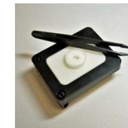
生きた昆虫観察用ホルダー