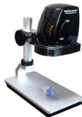
ポータブルフィールドスタンド