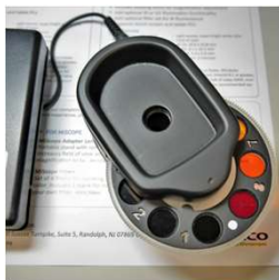
フィルターホイール

紫外LED搭載の高解像モデルにて蛍光観察するためのアクセサリです。 フィルター中心波長(nm): 490, 550, 565, 610, 670, 700, 760, 780,