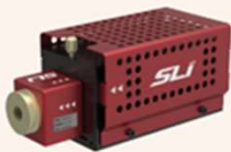
CWS Mighty Light Beam Assembly