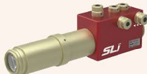
CWS Collimation Adapter Assembly