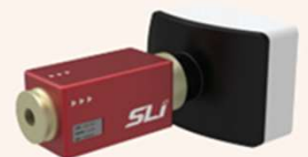
CWS CCD Assembly