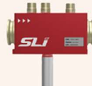
CWS Magnetic Base