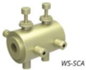
Supercontinuum source adapter To connect supercontinuum sources to wavelength selectors